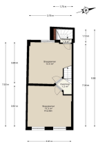
Sint Jorisastraat 6, Amsterdam Eerste verdieping

De plattegronden zijn indicatief en voor promotionele doeleinden gepresenteerd. Het kan kunnen geen-achtar worden ontbonden. www.NPFLS.nl