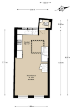
Sint Jorisastraat 6, Amsterdam Tweede verdieping

De plattegronden zijn indicatief en voor promotionele doeleinden gepresenteerd. Het kan kunnen geen-achtar worden ontbonden. www.NPFLS.nl