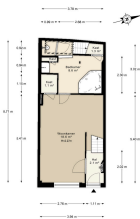
Sint Jorisastraat 6, Amsterdam Begane grond

De plattegronden zijn indicatief en voor promotionele doeleinden gepresenteerd. Het kan kunnen geen-achtar worden ontbonden. www.NPFLS.nl